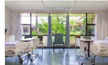
Patientenzimmer patient rooms habitacion de pacientes les chambres des patients, Больничные палаты