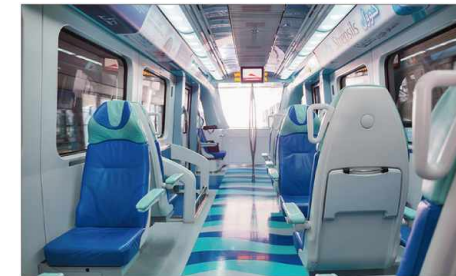
Transportmittel transportation medios de transporte mode de transporte Транспорт