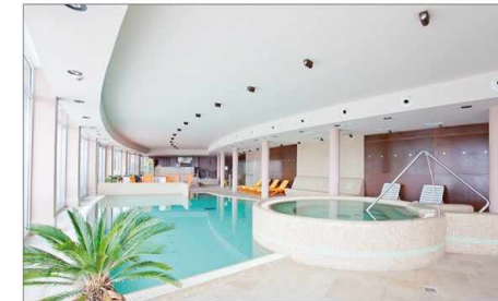
Schwimmbäder swimming pools piscinas piscines Бассейны