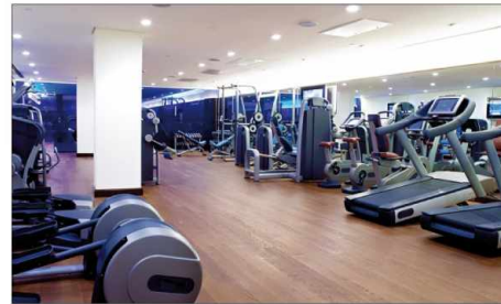
Fitnesscenter gym gimnasio centre de fitness Фитнесс центры