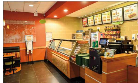
Restaurants restaurants restaurantes epicerie Рестораны