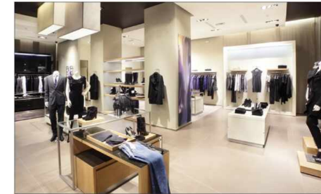
Verkaufsräume shops Tiendas lespace de vente Торговые залы