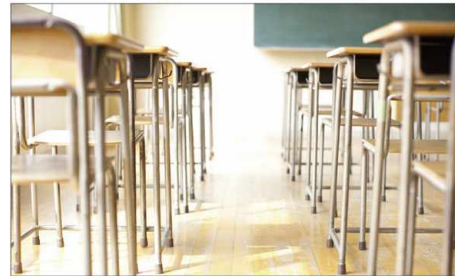
Schule & Kindergärten School, kindergarden escuelas, guarderia, ecoles, maternelles Школы и детские сады