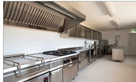
Küche kitchen cocina cuisine Кухни