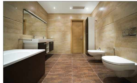
Sanitärbereiche sanitary sanitario sanitaire Санузлы, туалеты

cleans and dries various floors inside in only one operation limpia y seca varios pisos en el interior en sólo fase de trabajo. Nettoie et sèche en une seule opération. AllCleaner чистит и сушит любые напольные покрытия всего за одну операцию.