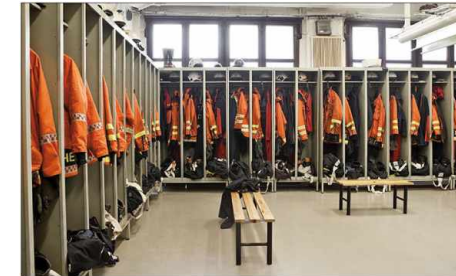
Umkleiden changing rooms vestuarios vestiaires Раздевалки